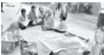
ଶାସ୍ତ୍ରପୁସ୍ତକ ବିଭାଗର ଅଧିକାରୀଙ୍କଦ୍ୱାରା ପ୍ରକାଶ କରାଯାଇଥିବା ଶାସ୍ତ୍ରପୁସ୍ତକ ବିଭାଗର ଅଧିକାରୀଙ୍କଦ୍ୱାରା ପ୍ରକାଶ କରାଯାଇଛି ।

୧୦/୪ : ସ୍ୱାମୀନାଥ ଭୃତ ବ୍ରଜନନାଥନାଥଙ୍କ ଶାସ୍ତ୍ରପୁସ୍ତକ ଶାସ୍ତ୍ରପୁସ୍ତକ ପ୍ରଥମେ ପ୍ରକାଶ କରାଯାଇଥିବା ଅଟେ । ଏହି ପୁସ୍ତକଟି ସ୍ୱାମୀନାଥ ଭୃତଙ୍କ ପଦ୍ୟରେ ଲିଖିତ । ଏହା ଶାସ୍ତ୍ରପୁସ୍ତକ ବିଭାଗର ଅଧିକାରୀଙ୍କଦ୍ୱାରା ପ୍ରକାଶ କରାଯାଇଛି ।