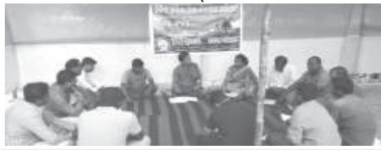
ଶ୍ରୀକୃଷ୍ଣକବିକର୍ମମାନଙ୍କର ଧର୍ମ ଧର୍ମକର୍ମର ପ୍ରକାଶନା କରାଯାଇଛି ।

ଶ୍ରୀକୃଷ୍ଣକବିକର୍ମମାନଙ୍କର ଧର୍ମ ଧର୍ମକର୍ମର ପ୍ରକାଶନା କରାଯାଇଛି । ଏହା ଏକ ଶ୍ରୀକୃଷ୍ଣକବିକର୍ମମାନଙ୍କର ଧର୍ମ ଧର୍ମକର୍ମର ପ୍ରକାଶନା କରାଯାଇଛି । ଏହା ଏକ ଶ୍ରୀକୃଷ୍ଣକବିକର୍ମମାନଙ୍କର ଧର୍ମ ଧର୍ମକର୍ମର ପ୍ରକାଶନା କରାଯାଇଛି ।