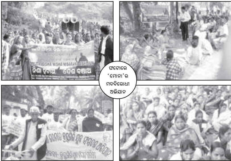
ଫଟୋରେ 'ମୋନା'ର ମଦବିରୋଧୀ ଅଭିଯାନ

ମୁଖ୍ୟ ସମ୍ପାଦକ : ପଦ୍ମତରଣ ନାୟକ ସମ୍ପାଦନା ମଣ୍ଡଳୀ : ଓଡ଼ିଶା ବିକାଶ କୁମାର ସ୍ୱାଇଁ, ବାସନ୍ତୀ ଆରାୟୀ, ବୈଜୟିନୀ ମିଶ୍ର ପ୍ରକାଶକ : ମିଳିତ ଓଡ଼ିଶା ନିଶାନିବାରଣ ଅଭିଯାନ (ମୋନା) ପୁସ୍ତକ ନଂ: ୮୫୩୩/୧୪୩୧, ପ୍ରଗତି ନର୍ସିଂହୋମ (୨ୟ ମହଲା), ମଧୁସୂଦନ ନଗର, ଯୁନିଟ୍-୪, ଭୁବନେଶ୍ୱର-୭୫୧୦୦୧, ଓଡ଼ିଶା ଫୋନ୍: ୦୬୭୪-୨୩୧୦୨୧୦, ମୋ: ୯୯୩୮୮୮୩୪୪୫, ୯୪୩୭୭୭୯୪୧୨ e-mail : monnaodisha@gmail.com, web : www.monnaodisha.org