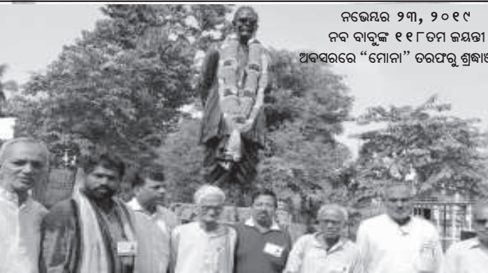
ନଭେମ୍ବର ୨୩, ୨୦୧୯ ନବ ବାବୁଳ ୧୧୮ତମ ଜୟନ୍ତୀ ଅବସରରେ "ମୋନା" ଚରଣକୁ ଶ୍ରଦ୍ଧାଞ୍ଜଳି ।

ରାଜ୍ୟରେ ମଦ ବିରୋଧରେ ହୁଣ୍ଡିଚାଳା, ସାମାଜିକ ବର୍ମା ଓ ସତ୍ତେବନ ନାଗରିକ ମାନେ ସ୍ୱର ଉତ୍ତୋଳନ କରୁଛନ୍ତି । କେଉଁ ସତ୍ତେବନ ନାଗରିକ ରାଜ୍ୟରେ ଓ ମିଳିତ ଓଡ଼ିଶା ନିଶା ନିବାରଣ ଅଭିଯାନର କମିଟି ଲାଭରେ ବାର୍ଷିକ ଅନୁକୂଳିତ ପୁଁ କର୍ମିଣୀକୁ ତାହା ଯେ ରାଜ୍ୟବାସୀଙ୍କ ଚରଣକୁ ଗାଳ୍ପିକ ନିୟମ କରୁଛି ପାଇଁ ସରକାରଙ୍କୁ ବିଆସାଇଥିବା ବେଳେ ସ୍ୱାକ୍ଷର ସମ୍ବନ୍ଧିତ ବର୍ମାପତ୍ରର ନିର୍ଦ୍ଧାରଣ ରହିବା ନାହିଁ । ପୁସ୍ତିକାକାରୀଙ୍କ ନିର୍ଦ୍ଦେଶକୁ ବାବଦରେ କରିବା ପାଇଁ କାର୍ଯ୍ୟକ୍ରମ ରାଜ୍ୟ ସମ୍ପଦ ପ୍ରଥ ଗୋଷ୍ଠୀ କରାଯିବା ସହିତ ଅନୁନିତର ବାମା ମଧ୍ୟରେ ମଦକୋକାର ଗୋଷ୍ଠିକା ପାଇଁ ନିୟମ ହେବା । ତେଜାବର, ବିଦ୍ୟାଳୟ, କର୍ମାଗାର ଓ ଜନସମ୍ବନ୍ଧିତ ସ୍ଥାନରେ ମଦ ଦୋକାନ ନ ଗଠିବା ଆକଳନ ଉପରେ କର୍ମି ମଦକୋକାର ମାନ ଶୋଭାଯାତ୍ରା ପାଠୁଛି । ଯେ କୌଣସି ଉତ୍ତର, ମୋନା, ମହାସାଧକରେ ମଧ୍ୟ ସ୍ୱଳ୍ପ ନିଆର ଉପରେ ଦେବାର ନିୟମ ପ୍ରଣୟନ ହୋଇପାଠୁଛି । ନିୟମ ଅଛି ଯେ ସରକାର : ଯଦି ପୁରୀର ବିଭିନ୍ନ ଗଣମାଧ୍ୟମ ଦ୍ୱାରା ସର୍ବସାଧାରଣଙ୍କ ଅବଗତ ଓ ଆପଣ ଅଭିଯୋଗ ନିମନ୍ତେ ଉପାଧିକ ସମୟ ଦେଇ ଅଭିଯୋଗର ବିଚାରକରି ନବୀକରଣ କରିବେ । ଏହା ମଧ୍ୟ ପାଳନ ହେଉନାହିଁ ଏବଂ କୁଳାଞ୍ଜପାରେ ନବୀକରଣ କରିଥିବା ସାଜଣି । ସୁଦ୍ଧା ସମାଜ ପାଇଁ ଏହା ଶୁଭକର ହୁଏ । ଏହି ନିୟମ କେବଳ ଧର୍ମକୁ ଆକ୍ରାନ୍ତର ସଦ୍‌ବୃତ୍ତ । ଯଦି ସରକାରଙ୍କ ଆଶ୍ଚର୍ୟକର ଅଛି ତେବେ ଆଜ୍ଞାମା ବିନରେ ନବୀକରଣ କରାଯିବାକୁ ଥିବା ମଦକୋକାର ନିଷେଧରେ ପଠିବ ରାଜ୍ୟରେ ବିଭିନ୍ନ ଗଣମାଧ୍ୟମରେ ଜନସାଧାରଣଙ୍କୁ ଅବଗତ କରାଇ ଆପଣ ଅଭିଯୋଗ କୁଣ୍ଡ ସୂଚିତାର କରି ପରଶେଷ ନିଆଯାଇ ପାରିଲେ ସମାଜର ମତର ହେବ । ପ୍ରିୟନାଥ ଅଧ୍ୟାୟୀ, ଶାନ୍ତଲୋ କଳ୍ପକଳ୍ପ, କେନ୍ଦ୍ରାପଡ଼ା, କଟକ