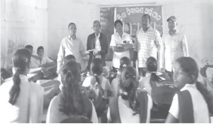
ନିଶା ନିବାରଣ ବିଦ୍ୟାଳୟ କାର୍ଯ୍ୟକ୍ରମ, ପିଣ୍ଡୁଡ଼ି, ରାଜକନିକା, କେନ୍ଦ୍ରାପଡ଼ା

ପୁରୀର ଉତ୍ତର (ନି.ପ୍ର) : ମିଳିତ ଓଡ଼ିଶା ନିଶା ନିବାରଣ ଅଭିଯାନ ସମାଜ ପୁରୀ ବାସିନ୍ଦା ପକ୍ଷରୁ ପ୍ରଭାତ ଘେରୁ ଜାତୀୟତା ଅନୁଷ୍ଠିତ ହୋଇଥିଲା । ଉତ୍ତରରେ ଅଭିଯାନର ଉଚ୍ଚ ଜାତୀୟତାରେ ଗାୟା କରାଯାଇ ମନରୁ ବିଦ୍ରବରେ ବର୍ମା ପ୍ରୋକ୍ତ ହେଉ ଚଳନକାରୀର ପୂର୍ଣ୍ଣ କରିବାକୁ ଆହ୍ୱାନ ଦେଇଥିଲା । ଏବେ ଚଳାଣୀ ପୁରୀରୁ ଉଦ୍ଧାର ଅଭିଯାନ ମଞ୍ଜୁରୀପାଳ ପ୍ରତିଷ୍ଠିତ ହୋଇଥିବା ବେଳେ ଅଭିଯାନର କରାଯିବାର ସୁବିଧାମୟ ଆହ୍ୱାନ ଦିଆଯାଇଥିଲା । 'ମୋନା' ସଂସଦ ଉତ୍ତରରେ ଶାନ୍ତୀର ଚଳନକାରୀର ପ୍ରତିଷ୍ଠାପନା ଉପରେ ପୂର୍ଣ୍ଣ ପ୍ରତିଶ୍ରୁତି ଦେଇ ପ୍ରତିଷ୍ଠା ପ୍ରଦାନ କରିବାକୁ ପ୍ରସ୍ତୁତ ହୋଇଥିଲା । ଏବେ ଚଳାଣୀ ପୁରୀରୁ ଉଦ୍ଧାର ଅଭିଯାନ ମଞ୍ଜୁରୀପାଳ ପ୍ରତିଷ୍ଠିତ ହୋଇଥିବା ବେଳେ ଅଭିଯାନର କରାଯିବାର ସୁବିଧାମୟ ଆହ୍ୱାନ ଦିଆଯାଇଥିଲା ।