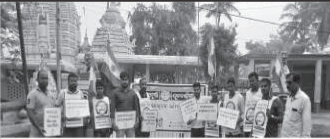
ମଦମୁକ୍ତି ଯୁଦ୍ଧ ବାହିନୀର ପ୍ରଭାତ ଘେରୁ କାର୍ଯ୍ୟକ୍ରମ